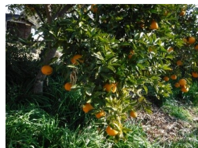
煙の夏ミカン今年もたわわに