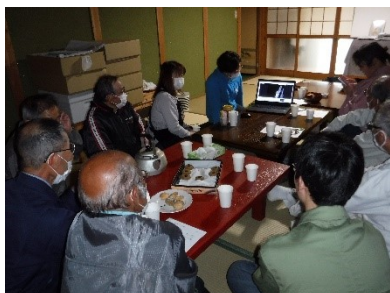
高松市アートシティー企画 「水」 Water Commune City に高原水車も取り上げ られ You Tube 鑑賞中