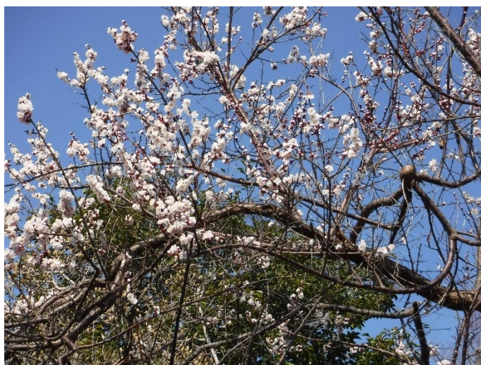
煙の梅は満開。友の会は松の木など手入れ、 見学者でにぎわう一日でした。