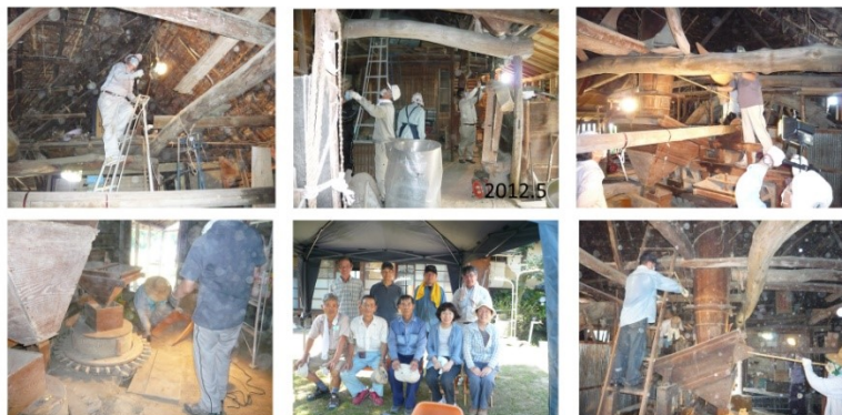
真夏の水車場掃除 2012.7

会員のみならず、年会費 1000 円を添付の振込用紙にてよろしく願いいたします。高原水車友の会口座は郵便局 01600 - 4 - 132809 です。