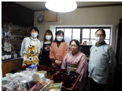
お抹茶の準備をしています。