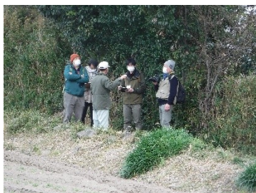
1 月 29 日 水車訪問