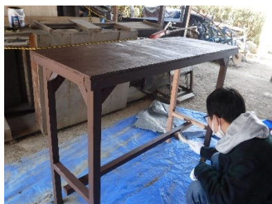
スタンドの塗装作業をする大学生