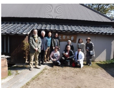
高校の同窓会の集まりで見学に来られ…