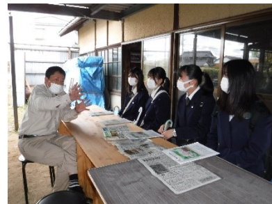
写真部の先生と生徒さん