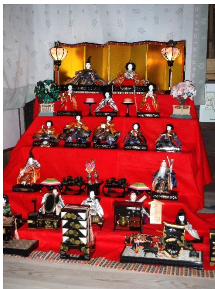
今年も雛祭りお茶会