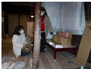
お雛飾り準備・片付け