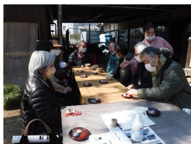
新しく友の会に加わっていただく