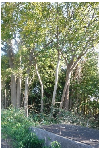
サイフォンの辺り

高原水車場から南方200メートルの古川沿いにこんもりした雑木林があった。古川改修前には、蛇行した川に沿って昼でも暗いような森が続いていた。その一部が残っており、付近に古川へ水を引き込むためのサイフォン装置がある。以前は気に留めていなかったが、土手に沿った細長い雑木林の一部サイフォンの近くは高原水車の所有である。土手に沿って細長く続く雑木林は、その東側の住宅の皆さんに迷惑をかけていた。隣の土地所有者の方とも相談して思い切って「森林組合」の方に全部伐採してもらった。藪とともに立派な木が茂っていたが仕方がない。