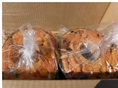
シフォンケーキの差し入れが