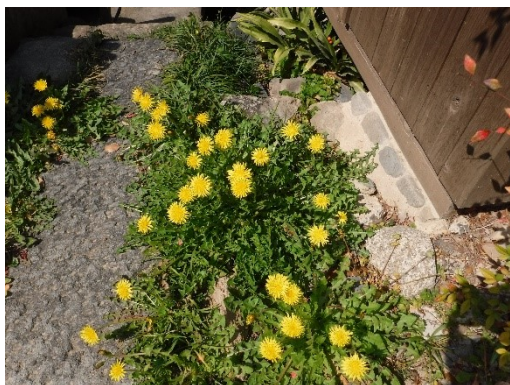
水路の傍に咲くタンポポ 前方の石段を降りると水車取水口があります。

狂気の嵐が吹き荒れる姿をテレビで見ているのはとてもつらいことです。ヨーロッパだけではなく、シリアやミャンマー、アフガニスタンにも飢餓に苦しむ人達がいて、気が休まりません。私たちの水車復元は小さな試みですが、水の恵みをうけて生活を支えていた先人の知恵を受け継ぎ、子供たちにダイナミックな水車の姿を見せたいと思っています。